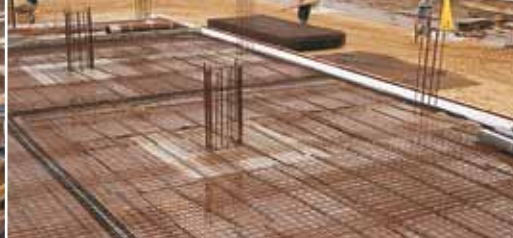
Замена бетонной подготовки под фундаментной плитой.