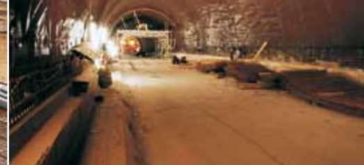
Эффективный дренаж поверхностей в тоннелях.