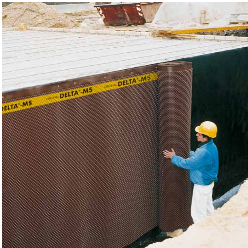
DELTA®-MS легко монтируется и обеспечивает надежную защиту стен фундамента.