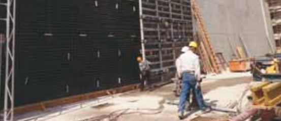
Строительство стены в грунте.